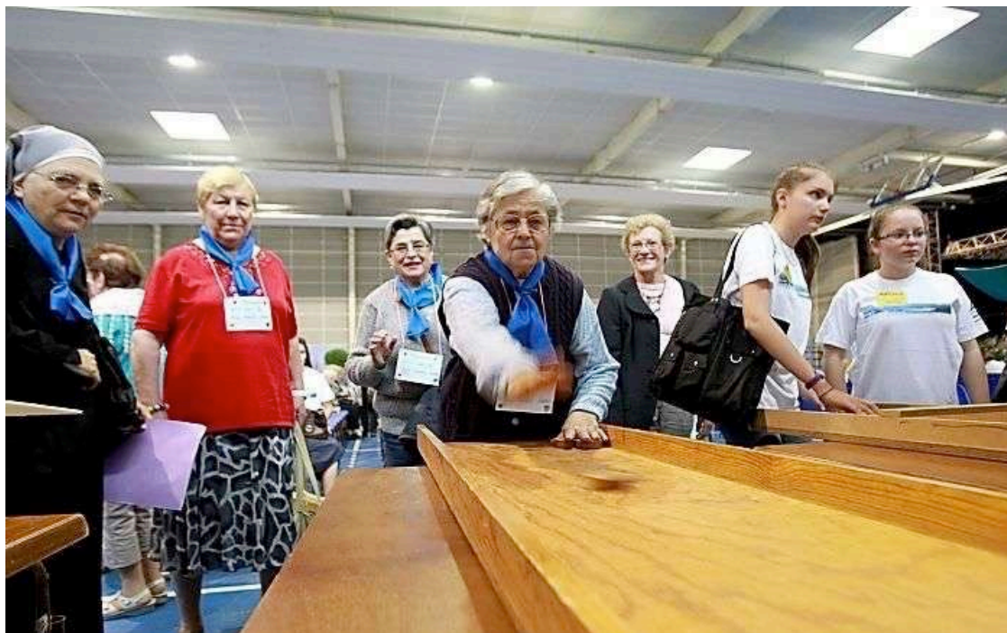
Comme ici à Mourenx en 2013, l'inter-génération sera de mise.

www.larepubliquespyrenees.fr/2016/09/29/semaine-bleue-a-pau-des-animations-pour-les-aines-du-3-au-9-octobre,2058227.php