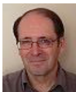
Par Jean-Jacques Nicomette Crédit Photo : AQUI

Pour en savoir plus : www.5-saisons-arbre.fr