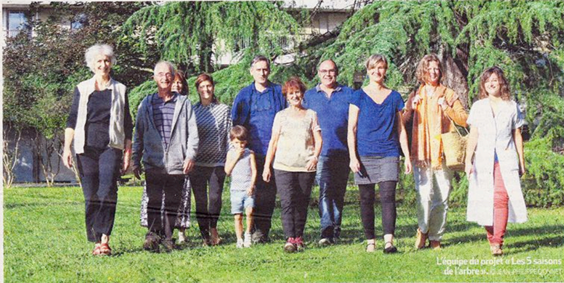
L'équipe du projet « Les 5 saisons de l'arbre ».