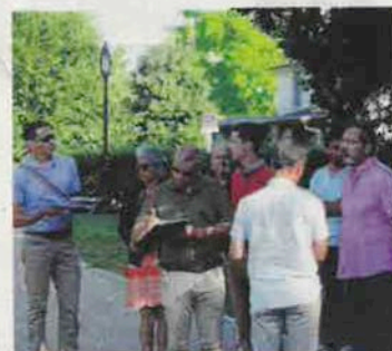
Le jury des Villes fleuries était de passage en août.

Une délégation du Conseil départemental des Hautes-Pyrénées rend visite, aujourd'hui, à la Ville de Billère