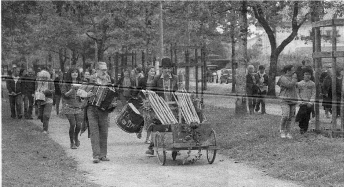
Ce dimanche, une déambulation musicale s'est tenue sur les allées de Morlaàs.